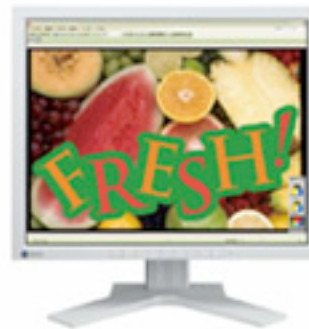
オリジナルモード